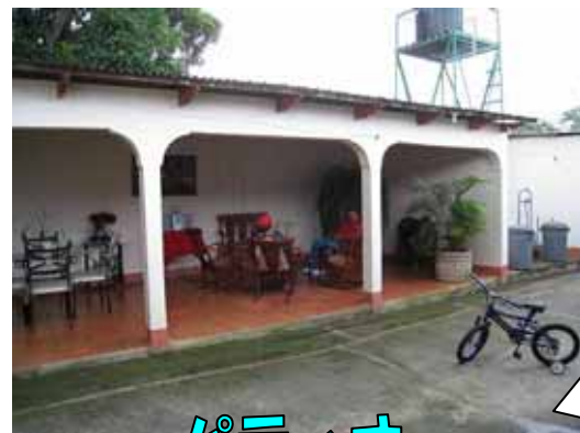
パティオ (子どもが遊ぶ場所)

家の中にはたくさんの部屋があります。1階ですが、日本の家より広いですね。テレビやパソコンもあります。ただ、あまり水が出なかったり、手でせんたくをしたり、たまに停電になったりするくろうもあります。お手伝いさんもいることがあります。