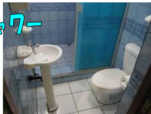
トイレとシャワー