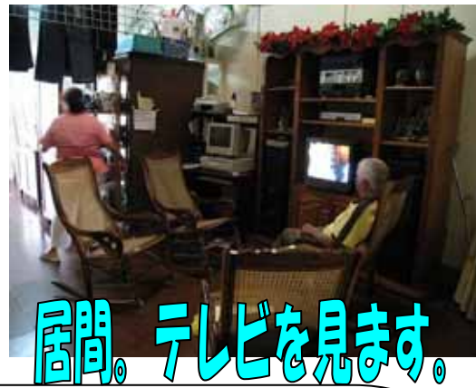
居間。テレビを見ます。

お父さん、お母さん お母さんのおじさん お母さんの弟、子ども の五人で住んでいます。